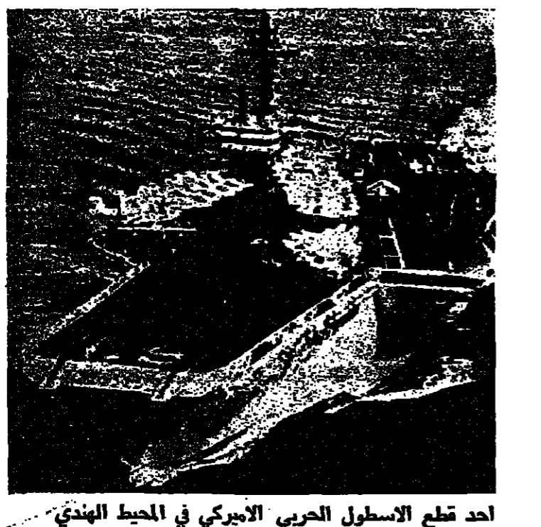
أحد قطع الاسطول الحربي الاميركي في المحيط الهندي

شكوك اوروبية في الاثر الجماعية لهذا الوضع تخلف سؤال حول التقييم الاميركي وقد زادت حدة هذه التساؤلات في أعقاب الملاحظات التي ايداه الرئيس كارتير والتي قال فيها انه اجري تقييما للأعمال السوفياتية في افغانستان، وأنه قد لا يغير هذه الاعمال التي اجري تقييما للأعمال السوفياتية في مرحلة جديدة في السياسة السوفياتية. وهذا التناقض في المواقف الاميركية هو الذي يدفع قادة اوروبا الغربية كالاستر الذي جلبت تسميت والرئيس الفرنسي